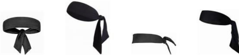
Diagrama 1. Ejemplos de cintas para el pelo tipo bufanda

4-4 Afirmación: No se permite llevar cintas para el pelo tipo bufanda.