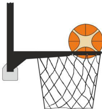
Diagrama 4 Balón dentro de la canasta

31-23 Afirmación: Es una violación de interferencia si un defensor toca el balón mientras el balón está dentro de la canasta.