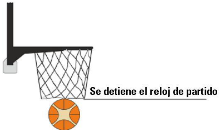
Diagrama 2. Tiro convertido

16-14 Ejemplo: A1 tira a canasta. B1 toca el balón que está dentro de la canasta, pero que no la ha atravesado aún por completo.